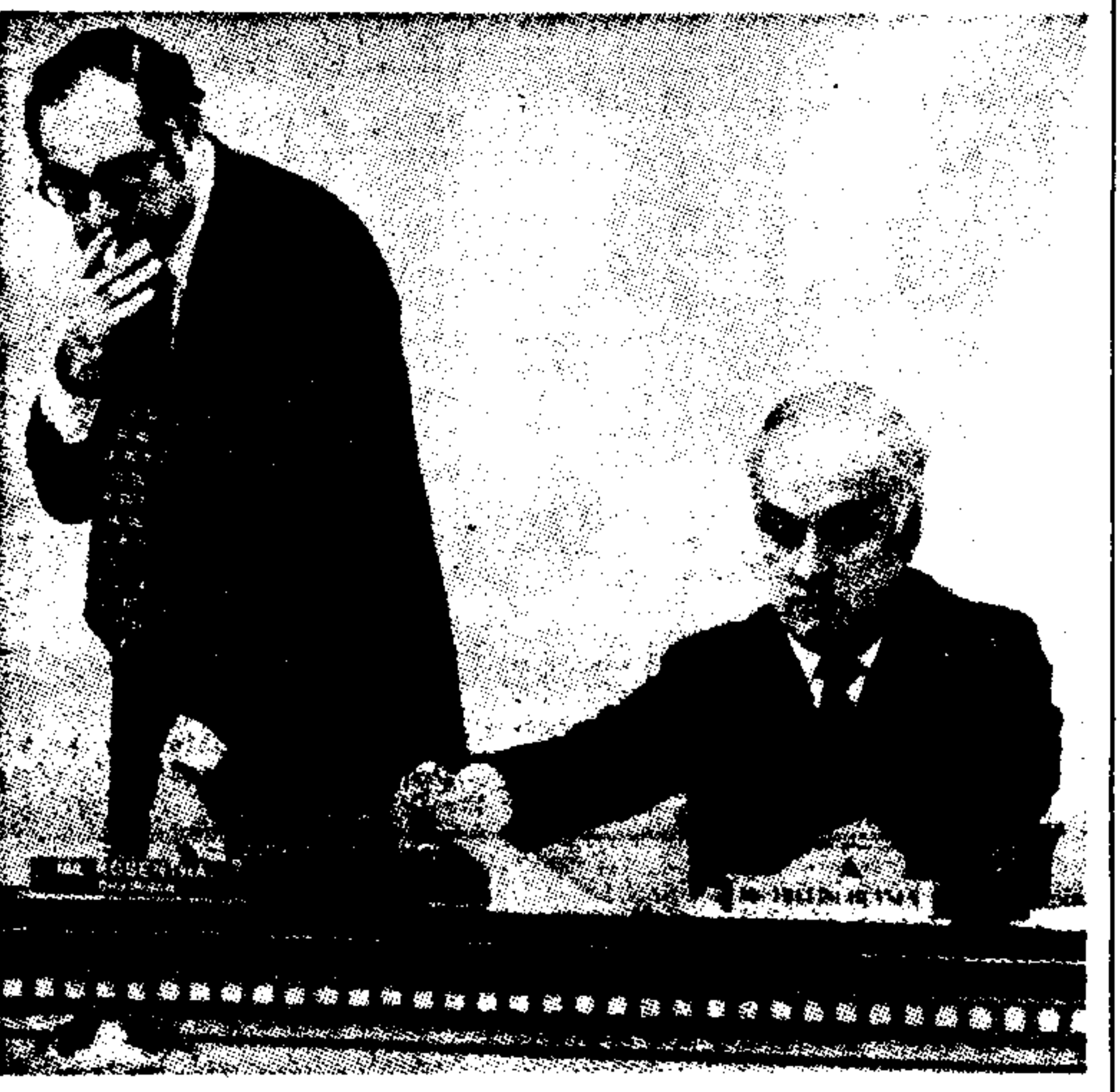
Σε σύγκριση μεταξύ του προέδρου της υποεπιτροπής...